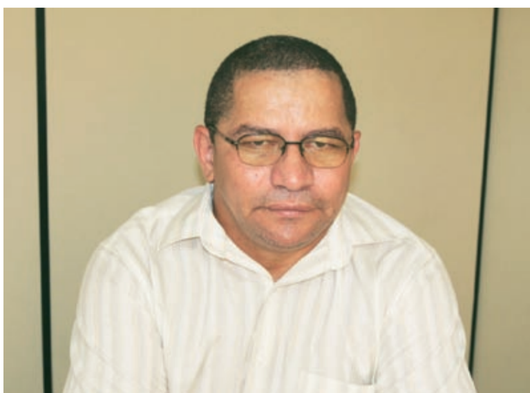
Buda disse que a empresa já está em condições de atender os trabalhadores

mudou e o volume de produção permite que a empresa comece a resolver os problemas”, destaca Buda.