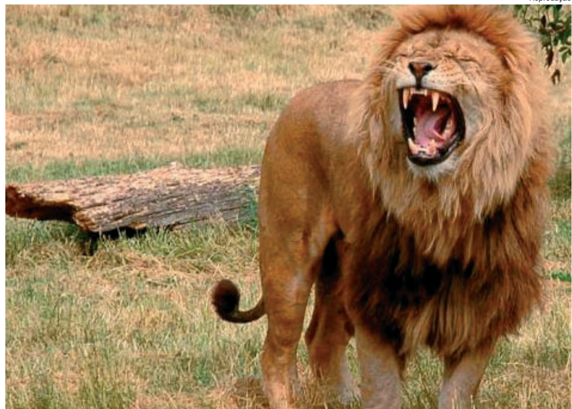
Reprodução Quem entrega declaração antes tem restituição antecipada e se livra do leão mais rapidamente

Assim, em caso de eventuais problemas, haverá tempo hábil para resolvê-los, evitando ter de enviar declaração retificadora depois, já fora do prazo.