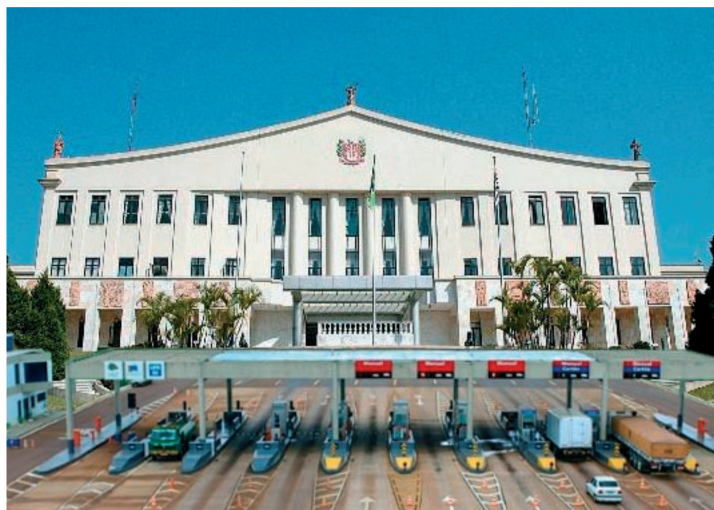
Se depender dos governos tucanos, os pedágios serão instalados em todo lugar, inclusive para entrar no Palácio dos Bandeirantes

Número de postos em São Paulo é o maior do Brasil e também o que mais sobe. Eram 40 em 1997 e saltaram para 225, hoje. Aumento é resultado da privatização das estradas promovida por governos do PSDB.